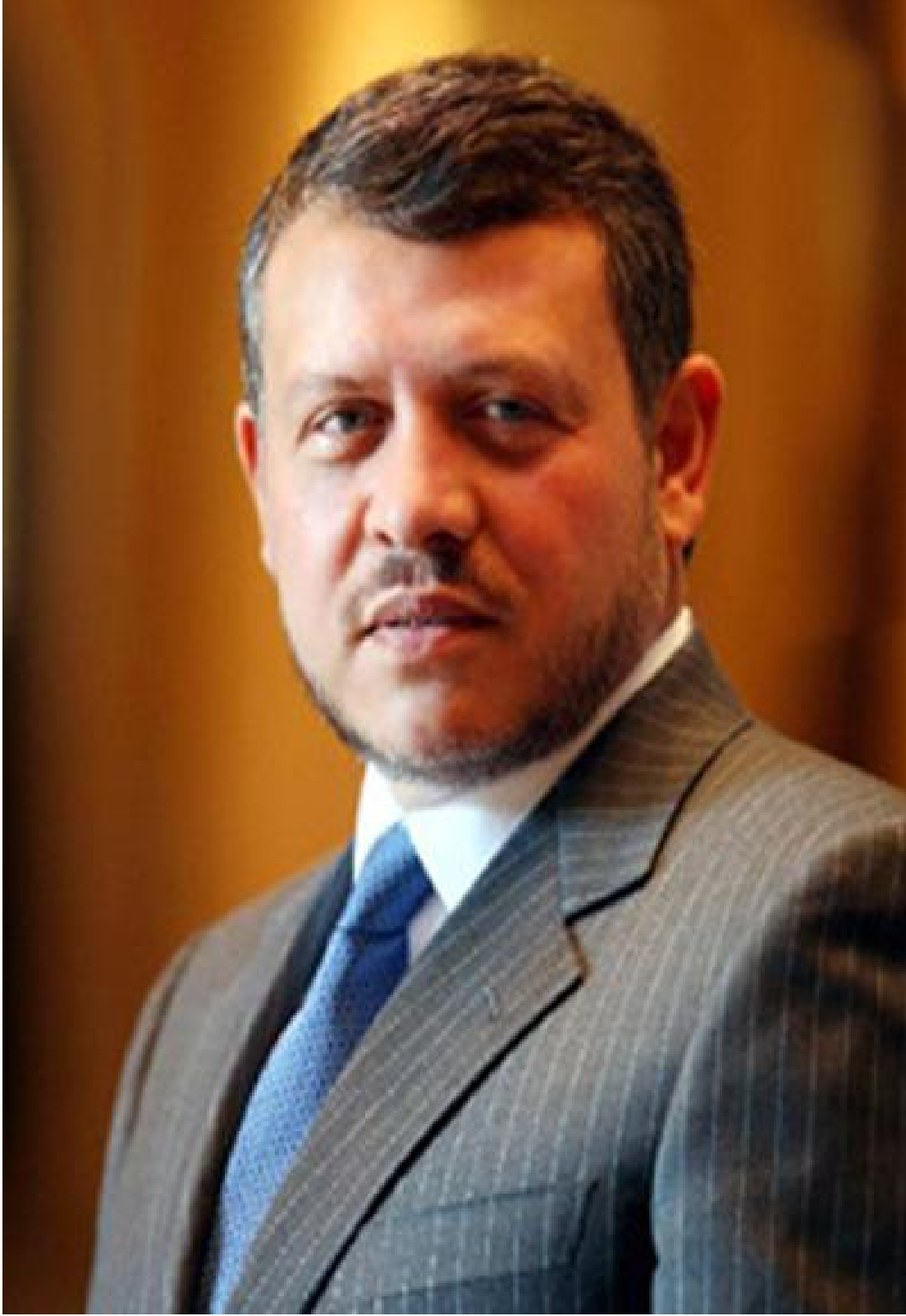
حضرة صاحب الجلالة الملك عبدالله الثاني ابن الحسين المعظم