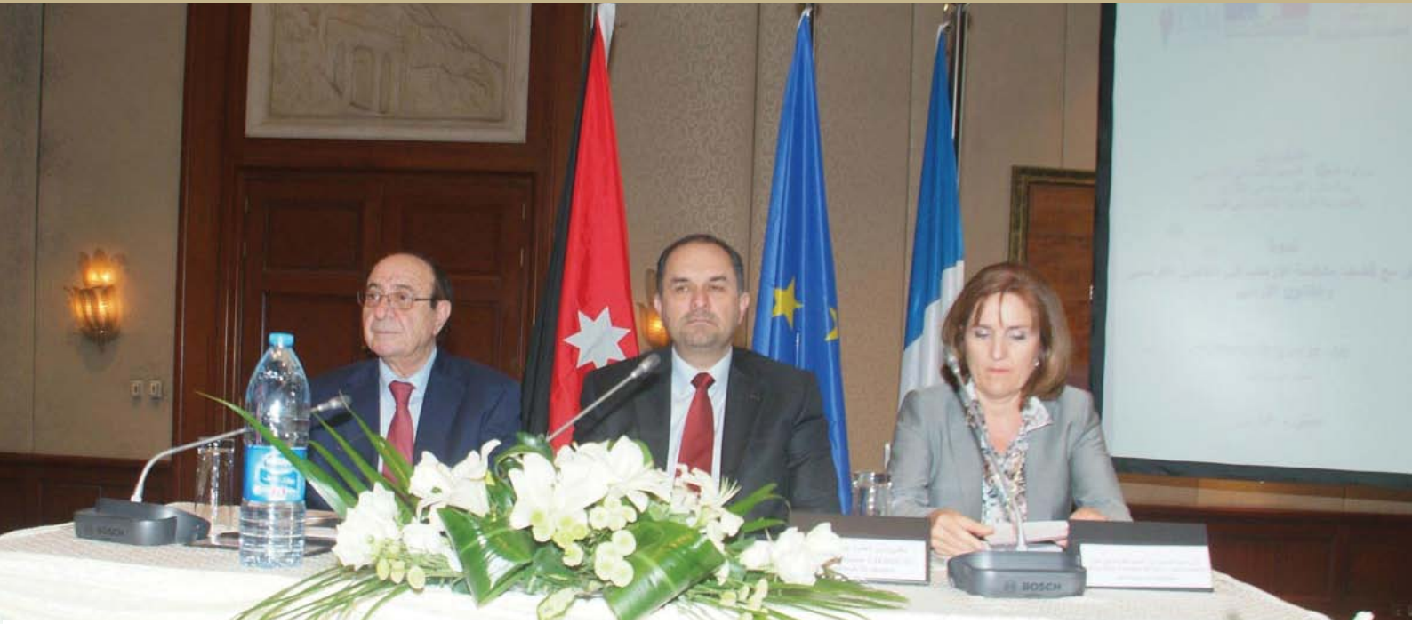
وزير العدل الدكتور بسام التهلوني يفتتح ندوة "التعامل مع قضايا مكافحة الارهاب في القانون الفرنسي و الاردني"

وقال مدير عام المعهد القضائي الاردني القاضي منصور الحديدي ان انعقاد هذه الندوة يأتي تحقيقا للرسالة والاهداف التي ينهض بها المعهد والتي تندرج ضمن برامج التدريب المستمر والتخصصي لتمكين القضاة والمدعين العامين والمشاركين من التواصل مع المستجدات بشقيها القانوني والقضائي، لافتا الى انها فرصة تمكن المشاركين من الخبراء الفرنسيين والاردنيين من تبادل المعارف والخبرات ما ينعكس ايجابا على فكر القاضي وعمله.