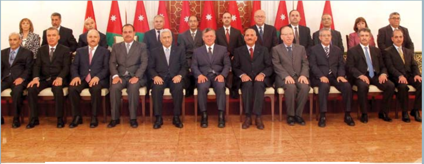
صدور الإرادة الملكية بالموافقة على إجراء تعديل وزاري على حكومة النسور

الأردنية، كما عمل في القطاع الخاص محامياً لمدة تزيد عن عشرين عاماً، وكذلك مستشاراً قانونياً للعديد من المنظمات الدولية والخاصة وهو. المناصب التي شغلها: - استاذ القانون في كلية الحقوق بالجامعة الأردنية - رئيس المركز الوطني للملكية الفكرية - شغل منصب: "مراقب عام الشركات" في وزارة الصناعة والتجارة ٢٠١٢/٢٠١١ - عضو في لجنة الاجندة الوطنية.