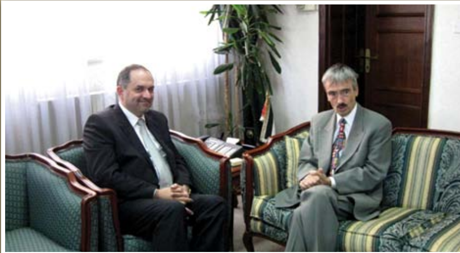
وزير العدل الدكتور بسام التلهوني يبحث مع السفير البريطاني التعاون القانوني

بحث وزير العدل الدكتور بسام التلهوني مع سفير المملكة المتحدة لدى الأردن بيتر ميليت سيل الاستفادة من الخبرات البريطانية في مجال استرداد الموجودات والوساطة القضائية. واستعرض الجانبان خلال لقاؤهما في وزارة العدل أوجه التعاون القائم بين الحكومتين الأردنية والبريطانية خاصة في المجالات القانونية والقضائية.