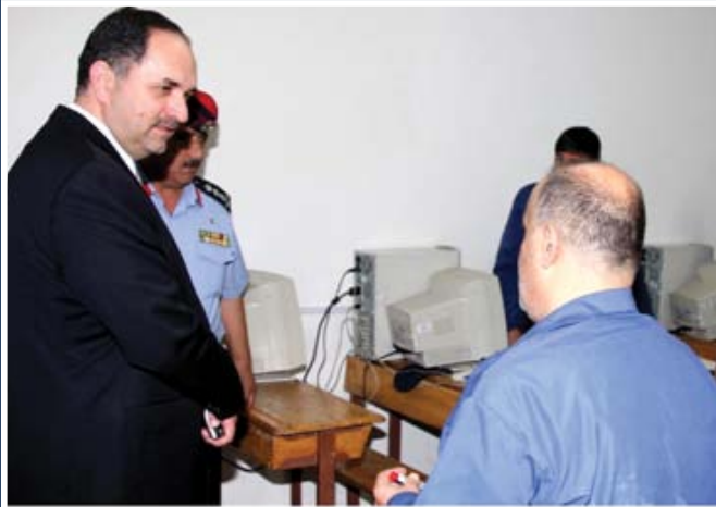
وزير العدل يزور مركز إصلاح وتأهيل البلقاء

يشار الى ان عدد القضاة في قصر عدل اربد يصل الى ٩٠ قاضيا.