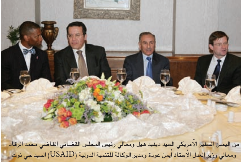
من اليمين السفير الأمريكي السيد ديفيد هيل ومعالي رئيس المجلس القضائي القاضي محمد الرقاد ومعالي وزير العدل الاستاذ أيمن عودة ومدير الوكالة للتنمية الدولية (USAID) السيد جي نوت

يومياً متزايداً على خدماتها، حيث تم تركيب نظام للاصطفاف الآلي، وحوسبة إجراءات الدائرة بما في ذلك الاحتساب التلقائي للرسوم، واتخاذ الترتيبات اللازمة للربط الإلكتروني مع بعض الوزارات والدوائر ذات العلاقة مثل وزارة الصناعة والتجارة ودائرة الاحوال المدنية. كما تم اطلاق خدمة التبليغات القضائية عبر البريد الإلكتروني والرسائل القصيرة (SMS)، وتوفير خدمة الاستعلامات