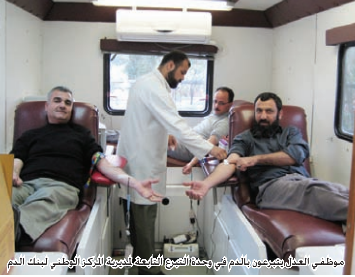
موظفي العدل يتبرعون بالدم في وحدة التبرع بالدم التابعة لمديرية المركز الوطني لبنك الدم