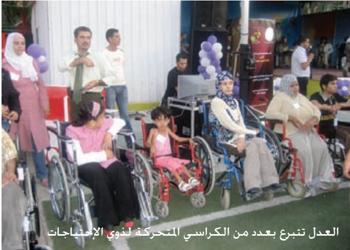
العدل تبرع بعدد من الكراسي المتحركة لذوي الإحتياجات

وجرى خلال المهرجان توزيع الكراسي على مستحقيها من الأطفال والمعاقين وعرضاً موسيقياً لفرقة زها الموسيقية التي قدمت خلالها مجموعة من الأغاني الوطنية والدبكات الشعبية.