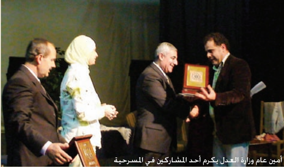
أمين عام وزارة العدل يكرم أحد المشاركين في المسرحية

وقد لاقى المسرحية اهتماماً وتفاعلاً ملحوظاً من قبل جمهورها من خلال الأسلوب التفاعلي وإبداء الرأي حول المواضيع المطروحة، بما ينسجم