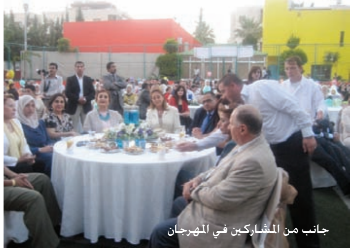
جانب من المشاركين في المهرجان

وتهدف المشاركة إلى تفعيل العمل الاجتماعي ودمج الطفل المعاق في الحياة الاجتماعية، ومد جسور التواصل بين موظفي الوزارة والمحاكم وبين نظرائهم لدى شركاء الوزارة الاستراتيجيين من القطاعين العام والخاص ومؤسسات المجتمع المدني بما يرسخ مبدأ الشراكة وروح الفريق الواحد.