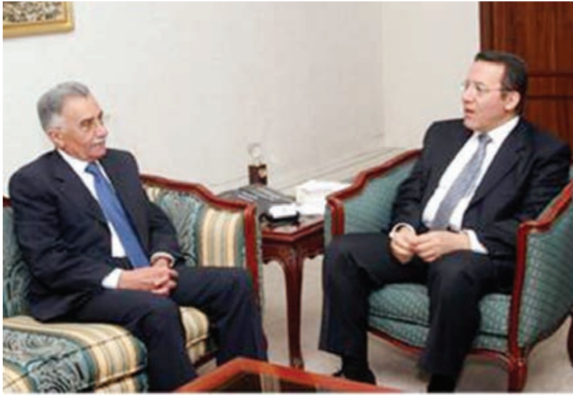
وزير العدل يبحث مع رئيس المجلس القضائي الفلسطيني مجالات التعاون المشترك.

وتأتي هذا الزيارة انطلاقاً من توجيهات جلالة الملك عبد الله الثاني في تقديم كافة أشكال الدعم والمساندة للسلطة الفلسطينية وللشعب الفلسطيني، بما يسهم في تعزيز التنمية الاقتصادية والسياسية والاجتماعية والقانونية في مختلف المؤسسات الفلسطينية.